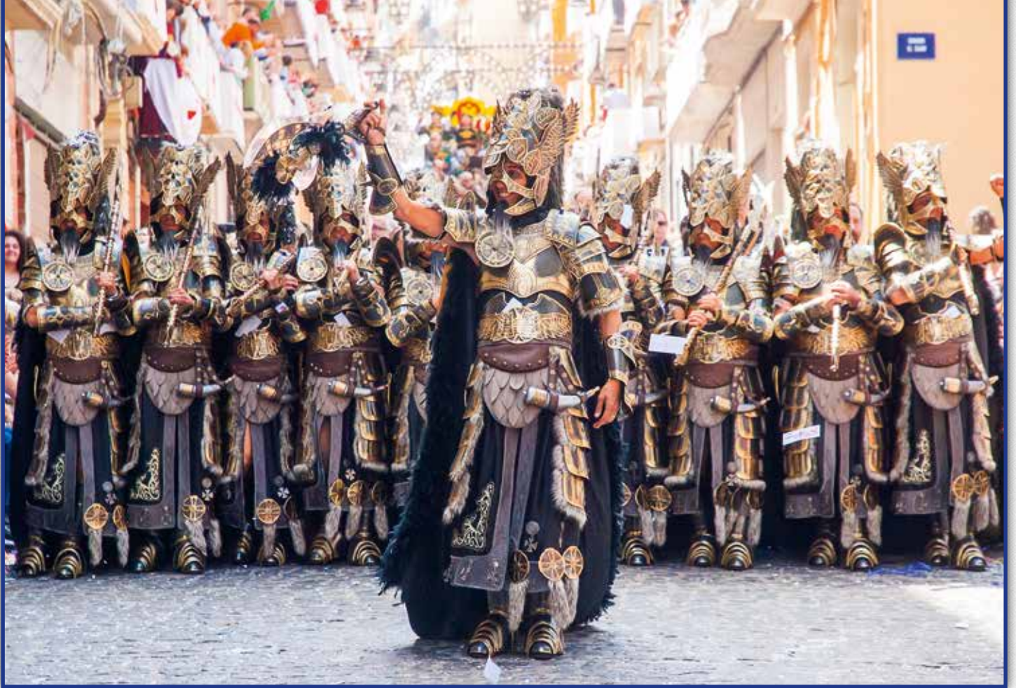
ESQUADRA MIG CRISTIÀ ~ FILÀ ALCODIANOS