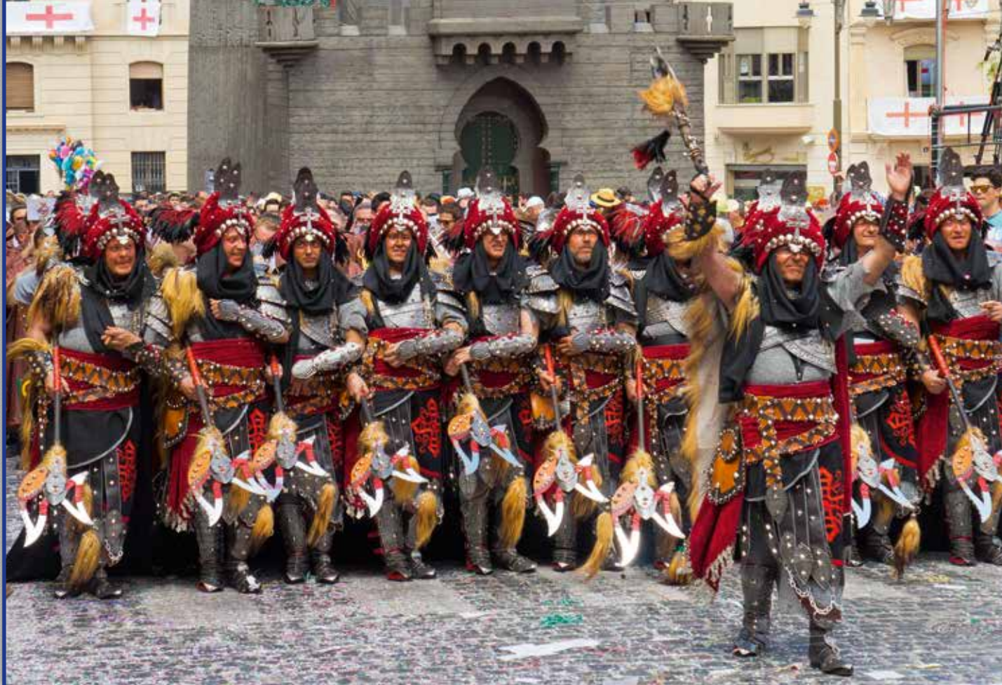
ESQUADRA ALFERES CRISTIÀ ~ FILÀ MOZÁRABES