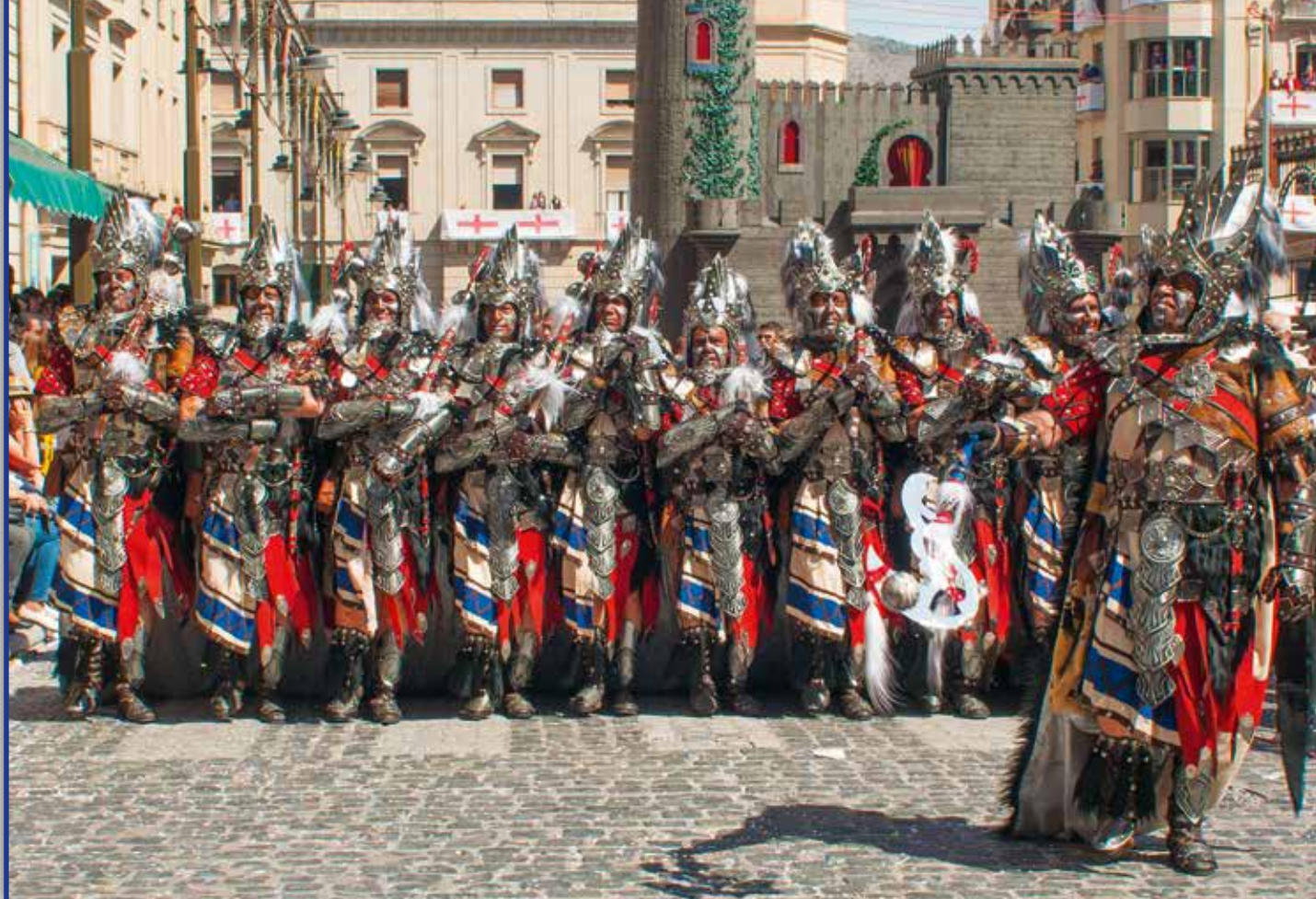
ESQUADRA CAPITÀ CRISTIÀ ~ FILÀ VASCOS